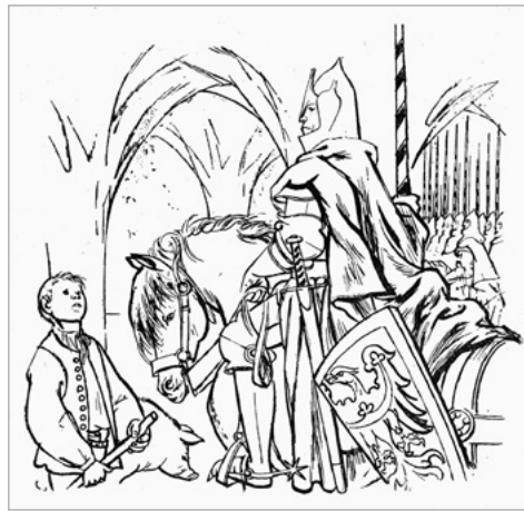
Ilustrace z knihy Ze slezské domoviny: pohádky a pověsti , Ostrava 1960.

Výstava je věnována lidové pověsti jako jednomu ze žánrů prozaické lidové slovesnosti. Pozornost je soustředěna na pověsti, které jsou v našem regionu známé a dochovaly se do dnešních dnů. Lidová pověst tvoří důležitou složku folkloru Těšínska. Vypráví o dávných historických událostech a osobách, založení měst a vesnic, pokladech nebo bájných postavách jako byl například vodník.